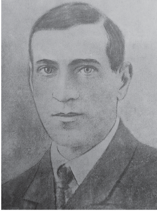
Еицырдыруа аґсуа поет Леуарса Көйтцниа диижтөи 105 шықәса тцует.

Леуарса Бида-иґа Көйтцниа диит 1912ш. декабр 31 рзы иахьатөи Очамчыра араион Аґара ақытан.