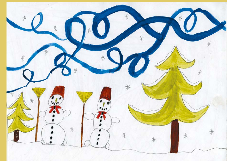
Асахья – Хьыбла Ануа