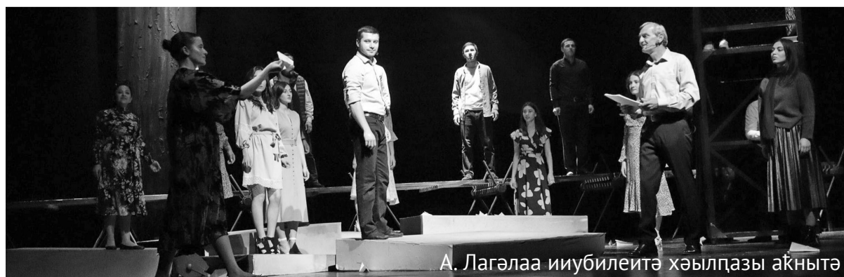
А. Лагэлаа ииубилейтә хәылпазы акнытә

Иаагыжы хынхәит зназы, Нас интәлеит уи хланцы. Ацәал шааизгы абон, Аха адгыл агәра агон!