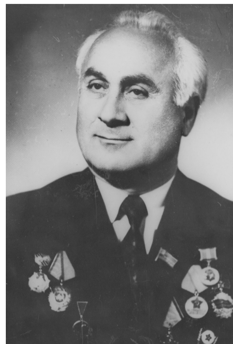
Алыкһса ЦЬОНУА – 105 ш.

Аха убранза, сымшьамба, Зны усыцоуп, зны усыкәуп, Зны суцоуп, амца сыкәуп, Абзабаа цқәа исырба.