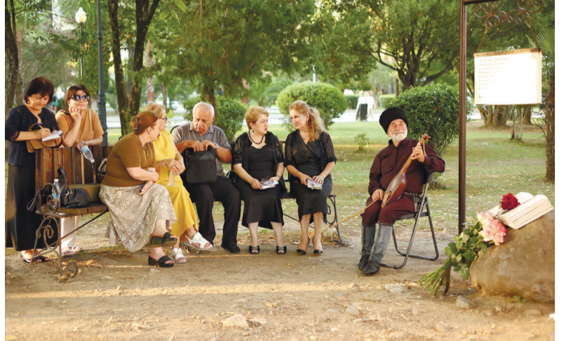
Е. Цышәлҗа лтыхимтақәә

Агазет «ААМТА» атызтыц: Акәа ақ., Зизариа имфа, 2